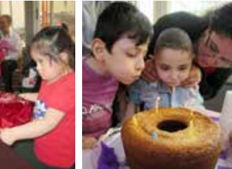
برنامج التدخل المبكر