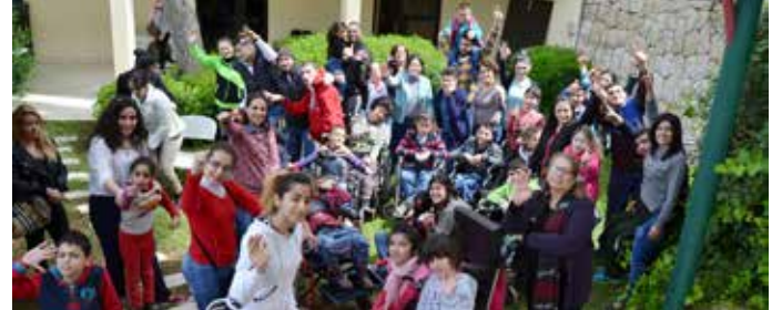
برنامج الإعاقة الجسدية